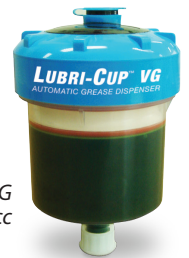
Lubri-Cup™ VG Mini – 250 cc