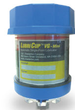
Lubri-Cup™ VG Mini – 120 cc